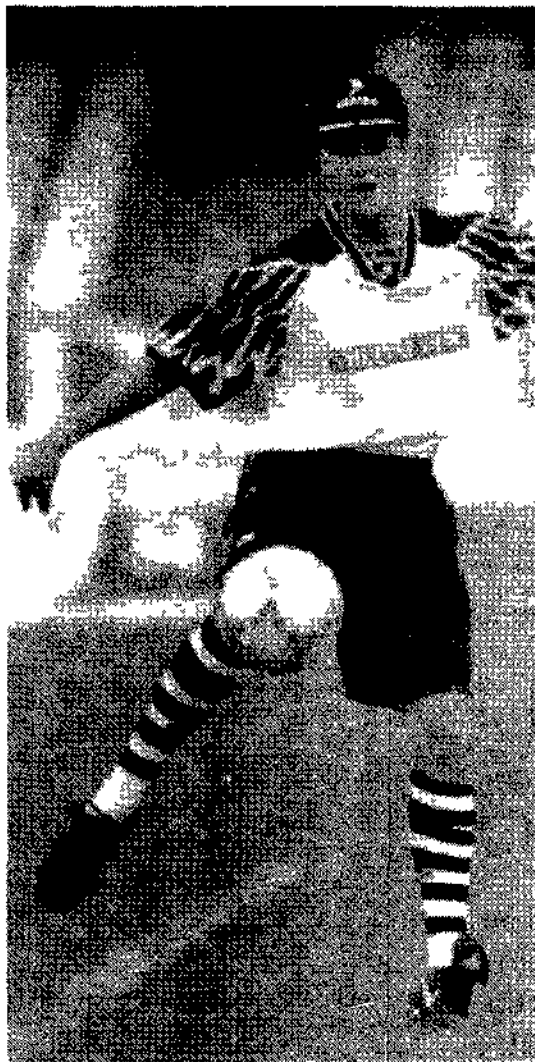
Il pilota di F1 Michael Schumacher nelle insolite vesti di calciatore

dichiarazione di rito del neoassunto «Sono soddisfatto Ho fretta di mettermi al lavoro e fare la mia prima stagione completa in F1 Sono sicuro di disporre di una vettura di nuovo competitiva capace di vincere dei Gran premi» E il vecchio? Accasato Coulthard alla Williams lo spazio si fa esiguo per il leone della mitologia automobilistica Ferman e Benetton espongono il cartello tutto completo Per Mansell non ci sarebbe, allora che un posticino alla McLaren A meno che la Mercedes che si è comperata in blocco la McLaren per razionalizzare le strategie di conquista del titolo mondiale, non nesca a realizzare il progetto più ambizioso che possa coltivare una casa tedesca assicurarsi le prestazioni di Michael Schumacher nuovo campione del mondo Schumacher è della Benetton Ma Flavio Briatore team manager della Benetton e acquirente della Ligier, uomo di non piccole ambizioni e di larghe vedute, tanto da essersi comprato in questi giorni persino la francese Kickers, scarpe per bambini potrebbe accontentare il suo piccolo grande amico, Bernie Ecclestone, presidente dei costruttori che vuole a tutti i costi far restare in F1 Mansell uno dei pochi in grado di assicurare spettacolo e audience Se Schumacher va alla Mercedes, si libera la prima poltrona della Benetton E il magnanimo Briatore farebbe un altro passo verso la poltrona della Foca su cui oggi siede Ecclestone che dicono si sogni ogni notte