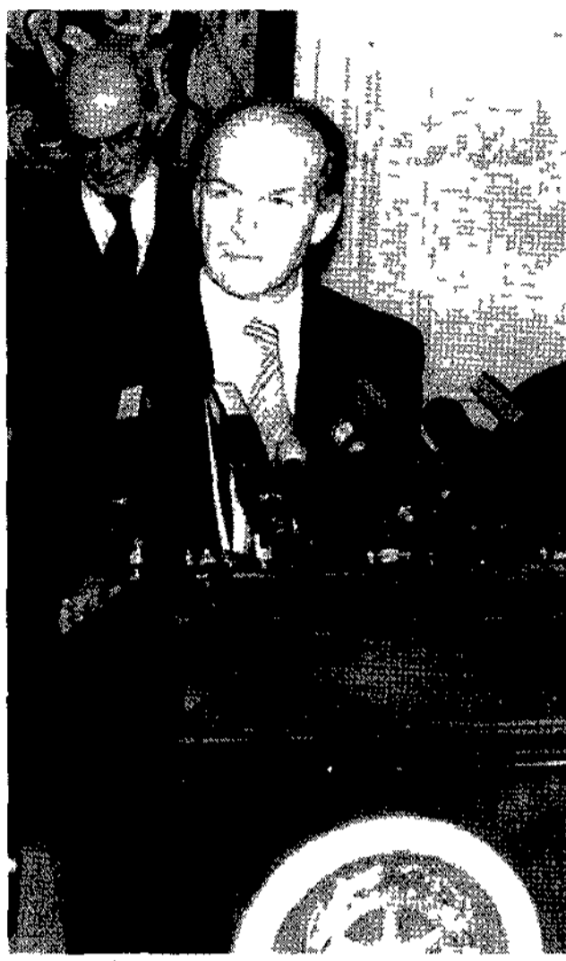
Il segretario di Rifondazione comunista Fausto Bertinotti

«Assoluto no al rinvio di Berlusconi alle Camere. Poi valuteremo i programmi»