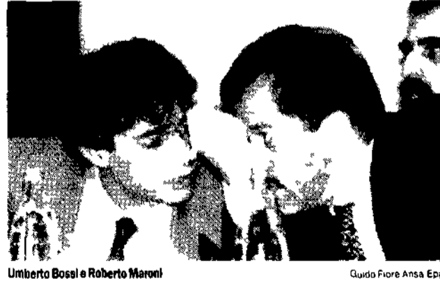
Umberto Bossi e Roberto Maroni