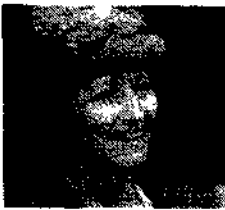
Che cosa può spingere un ragazzo o una ragazza a fuggire di casa?