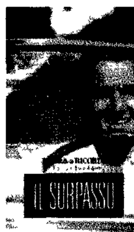
Joan Luis Trifunovic e Vittorio Gassman protagonisti del film 'Il sorpasso' diretto da Dino Risì. In alto la cassetta video distribuita da l'Unità

Esaurite nel giro di poche ore 380.000 copie del giornale con la videocassetta