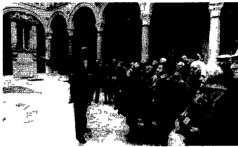
Un commesso di Palazzo Madama descrive al pubblico il cortile d'onore