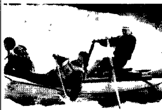
Kevin Bacon e Meryl Streep in «River Wild».