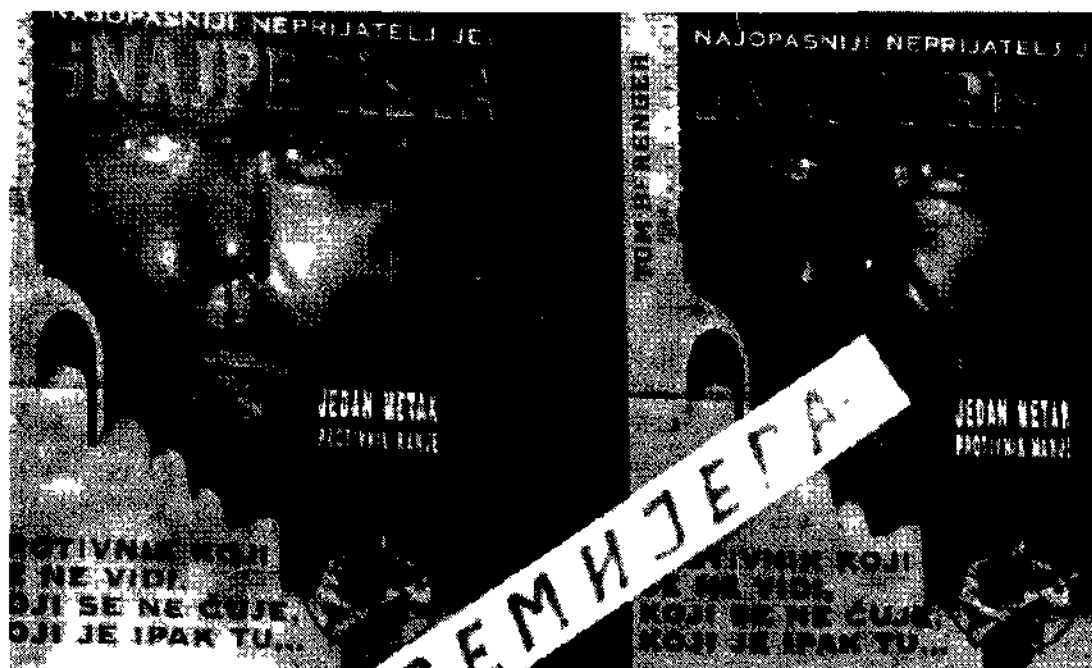
Manifesti cinematografici a Belgrado: il film si intitola «Il Cocchino», la scritta in cirillico significa «Primo».

BELGRADO Alcuni brevi cenni sulla situazione economica del cinema jugoslavo. Il mercato del cinema ha subito un colpo mortale dalla guerra civile e dalle sanzioni economiche imposte dalle Nazioni Unite.