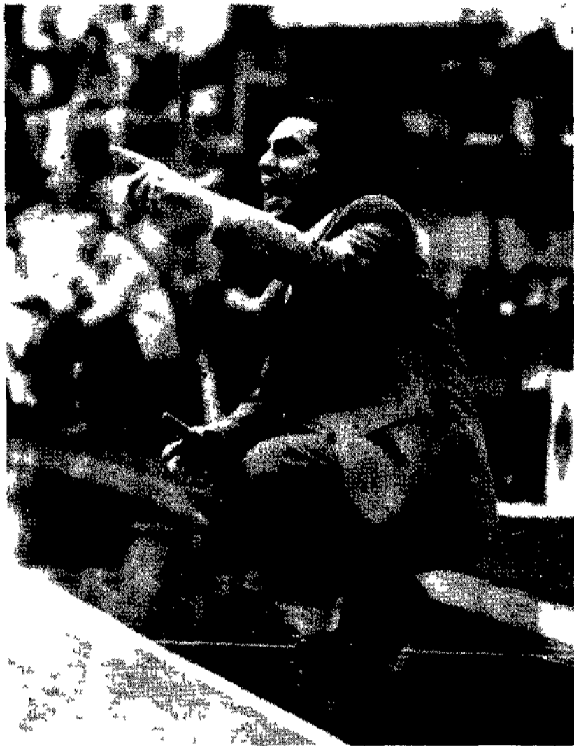
Sergio Scariolo, allenatore della Filodoro Bologna

sce alla perfezione la situazione, insomma. E spiega la sua tesi: «È inutile che noi allenatori, che i giocatori di grado facciamo scenate condite da gesti plateali. Il risultato di tutto questo è soltanto uno scaldare gli animi in tribuna. Nulla più. Ho visto delle scene pazzesche. Non sono altro che istigazioni alla violenza. È inutile nascondersi smettiamola di fare le verginelle. Il capitolo arbitri poi loro hanno il compito di fischiare i fatti, di mantenere il gioco nei binari della correttezza. Talvolta, però, c'è chi esagera, chi vuole diventare protagonista». Un'esasperazione sportiva che a volte degenera in atteggiamenti per così dire, estremi «Il basket - è ancora Scariolo a parlare - non è certamente catalogabile fra gli sport violenti però bisogna trovare la giusta maniera per cambiare l'indirizzo di alcune frange delle tifoserie. Anche fra i nostri supporters si annidano dei deficienti, capaci di rovinare un pomeriggio di sport. Ma la percentuale è contenuta, si può rimediare. Il tifo dovrebbe racchiudere ironia e cuore, mai sfociare negli insulti che si sentono in tutti i palazzetti d'Italia». Finora, a parte Reggio Calabria dovunque ha fatto tappa la Filodoro si è registrato il tutto esaurito. Un'occasione d'oro per Roma? Difile perché mancherà all'appuntamento il grande tifo capitolino e non ci sarà la solita affluenza emiliana.