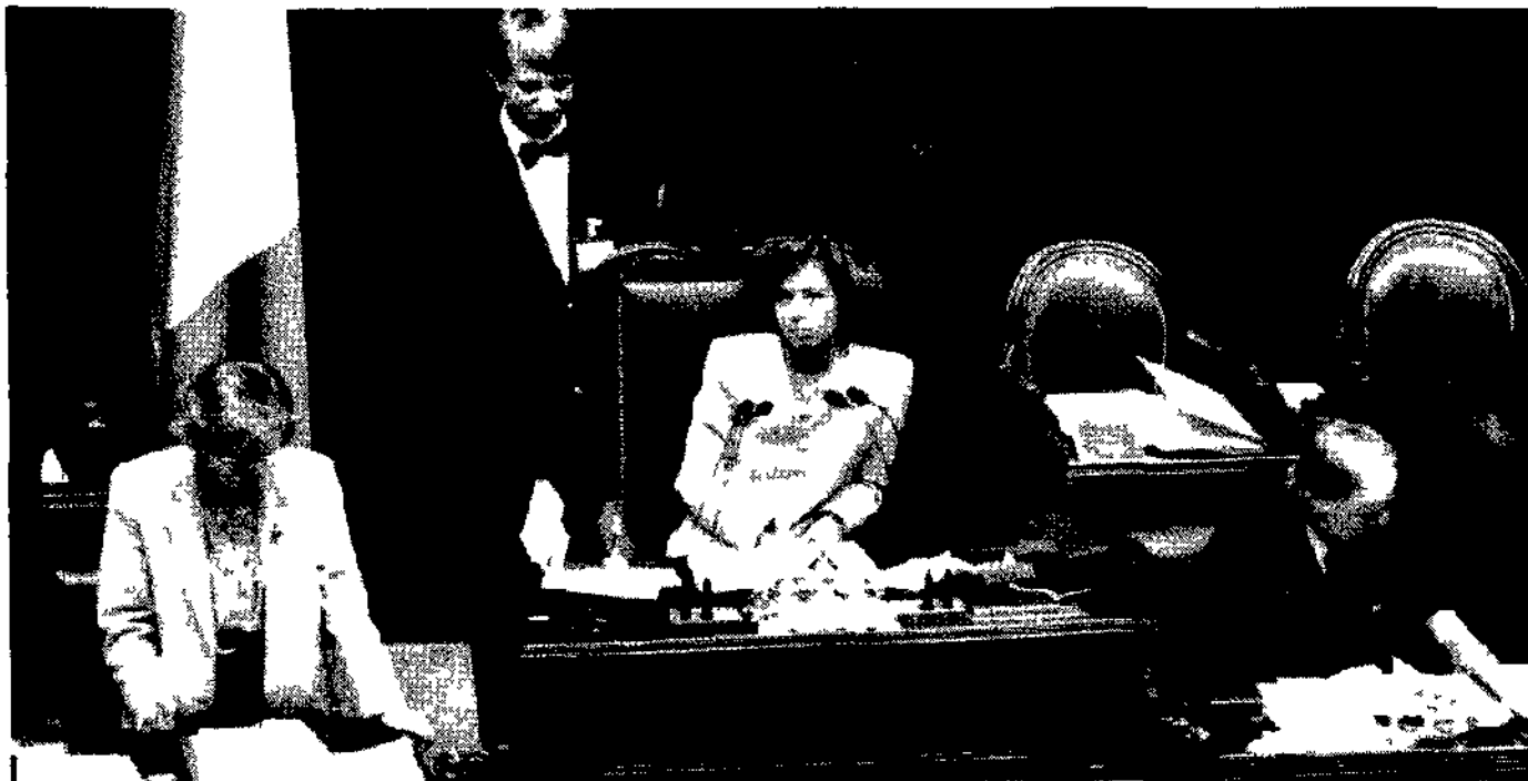
Il presidente della Camera Irene Pivetti

Respinta la pregiudiziale di costituzionalità presentata dai deputati di Berlusconi. Elia: «Un buon testo»