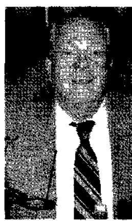
Jean Marie Le Pen