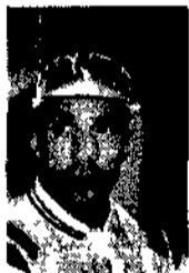
pugili a bordo ring c'era un equippe specializzato di medici