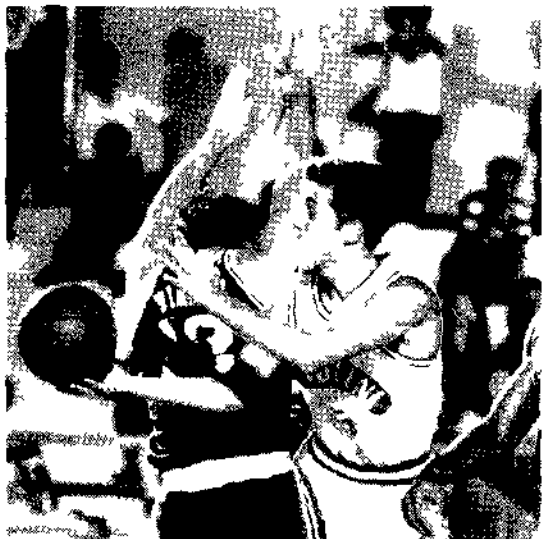
Un'immagine del match fra Scavolini e Benetton

BENETTON Gracis 9 Iacopini Pittis 10 Woolridge 20 Ragazzi 3 Naumoski 23 Vianini 2 Rusconi 25 N.E. Marconato e Esposito All D Antoni SCAVOLINI Pieri 5 Calbini Magnifico 11 Dell'Agnello Garrett 8 Gaines 22 Panichi 12 Riva 22 Costa 4 N.E. Brignoli All Bianchini ARBITRI Teofili (Roma) e Pozzani (Udine) NOTE Tiri Liberi Benetton 27/32 (Rusconi 9/10 Gracis 2/2 Naumoski 8/8 Woolridge 4/4 Pittis 4/6 Vianini 0/2) Scavolini 16/25 (Pieri 1/2 Magnifico 1/2 Costa 2/2 Riva 6/8 Panichi 1/2 Gaines 5/7 Garrett 0/2) Tiri da tre punti Benetton 3/10 (Naumoski 1/4 Ragazzi 1/2 Pittis 0/2 Gracis 1/2) Scavolini 8/15 (Pieri 0/1 Gaines 3/4 Panichi 3/5 Riva 2/5) Uscito per cinque falli Garret