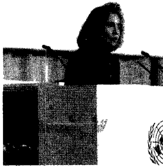
Hillary Clinton durante il suo intervento