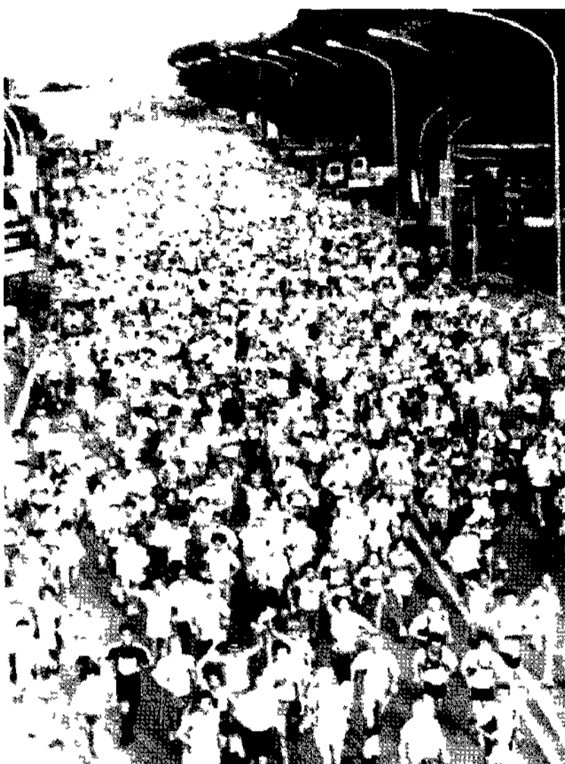
La partenza della Maratona Roma-Ostia nel febbraio scorso

Poco importi e domenica è un evento agonistico e serio. In questi giorni si è parlato di un evento di primo livello. Business, in primis, perché per questa prima edizione della nuova maratona internazionale di Roma, c'è un contratto di 100 milioni. Un contratto di 100 milioni. Un contratto di 100 milioni. Un contratto di 100 milioni.