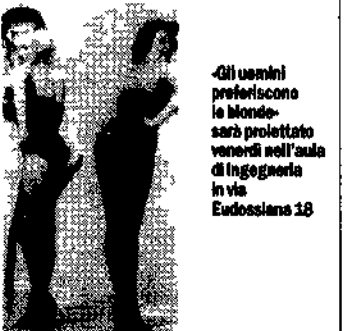
Gli uomini preferiscono le bionde sarà proiettato venerdì nell'aula di Ingegneria in via Ludovico 18

Ingegneria e film. L'Altra metà l'Altra metà il curioso titolo del ciclo bisettimanale in zio en nell'aula I di Ingegneria via Ludovico il Moro che presenta il film in cui hanno preso corpo le grandi protagoniste della vita della letteratura dello schermo Martedì 14 alle 20 C'è il Gaber in Mita Hani seguito al 20 di Giulio 11 un'incubo Venerdì 17 Maria Montone in Gli uomini preferiscono le bionde e alle 22 Il reente El la Ripley in Alda Telefono 44 59 269