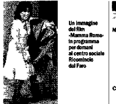
Un'immagine del film «Mamma Roma» in programma per domani al centro sociale Ricomincio dal Faro

Pomeriggio Fassbinder. Da lunedì fino al 31 marzo al Cinema dei Piccoli un'ampia retrospettiva pomeridiana del regista tedesco Rainer Werner Fassbinder Da lunedì a venerdì alle 16 e alle 18 Lunedi 13 La moglie del capostazione e il viaggio al cielo di Maria Küster Sottotitolo italiano via della Pineta 15 tel 85 53 485 [Eleonora Martelli]