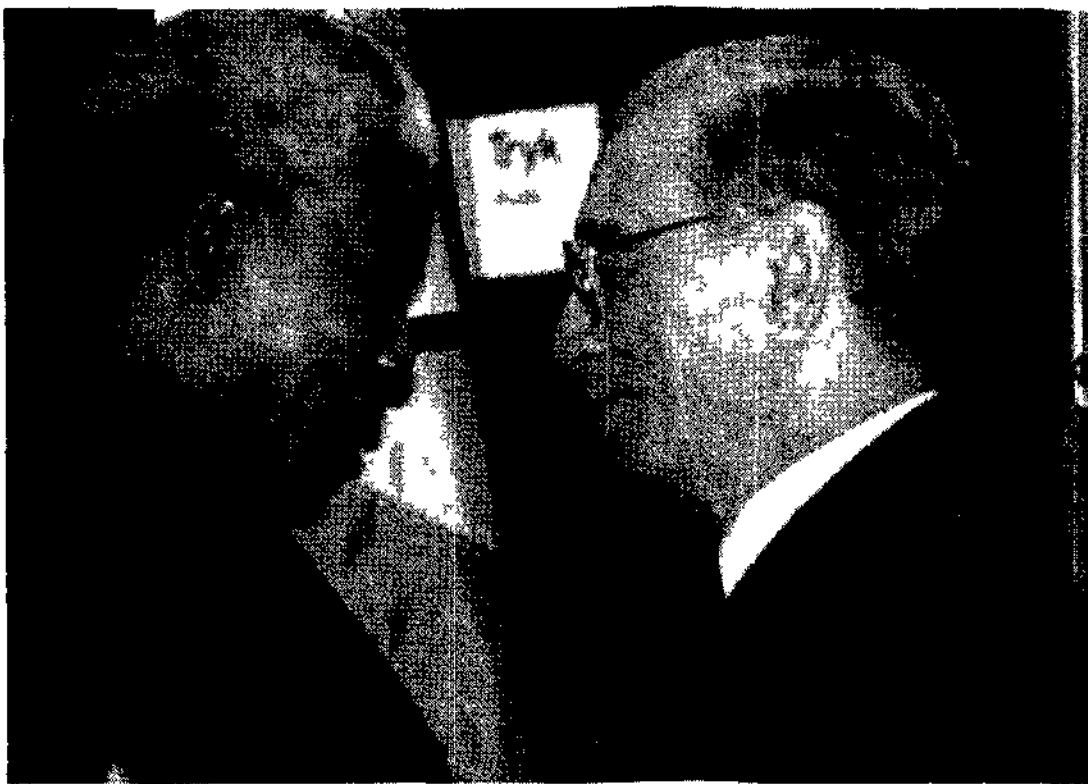
Il presidente sudafricano Nelson Mandela riceve un caloroso benvenuto dal segretario Olu Rototo Gbail al summit di Copenaghen

Il cancelliere austriaco Franz Vranitzky, intervenendo davanti alla platea dei capi di Stato e di governo al summit di Copenaghen, ha annunciato che l'Austria cancellerà 100 milioni di dollari di debiti ai Paesi del Terzo mondo.