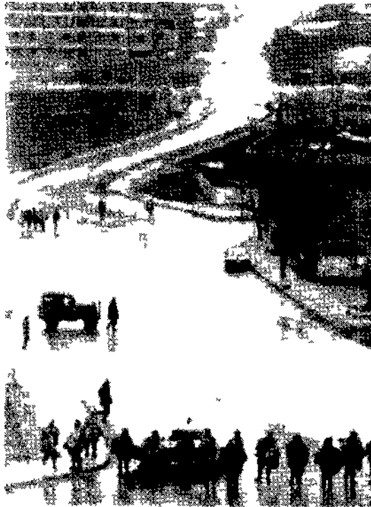
Una strada di Istanbul chiusa dalla polizia

Quattro morti in nuovi incidenti a Istanbul Teatro delle violenze stavolta il quartiere di Umranije sulla sponda asiatica del Bosforo ieri i funerali di alcune vittime degli episodi di domenica e lunedì scorsi a Gazi. Il coprifuoco esteso da Gazi a Umranije.