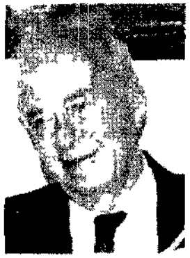
Yitzhak Rabin

Un tale groviglio di problemi e di punti di crisi la Turchia del 1995 stando ai più recenti sondaggi i sospetti popolari se non quelli degli inquirenti vanno sempre più orientandosi verso l'estrema destra.