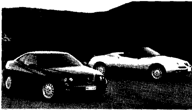
GTV e Spider. Innea e dotazioni quasi identiche. Sotto, la plancia del coupé

Con 145 146 nuova gamma 155 Spider e GTV e la vecchia 164... Alfa 155 nel solo Brasile