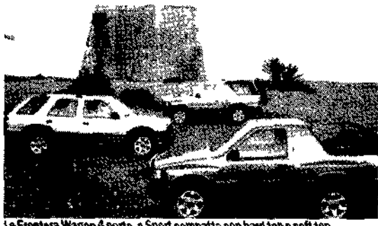
La Frontera Wagon 4 porte, e Sport compatta con hard top e soft top