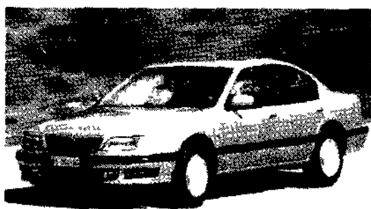
L'ammiraglia Nissan Maxima QX