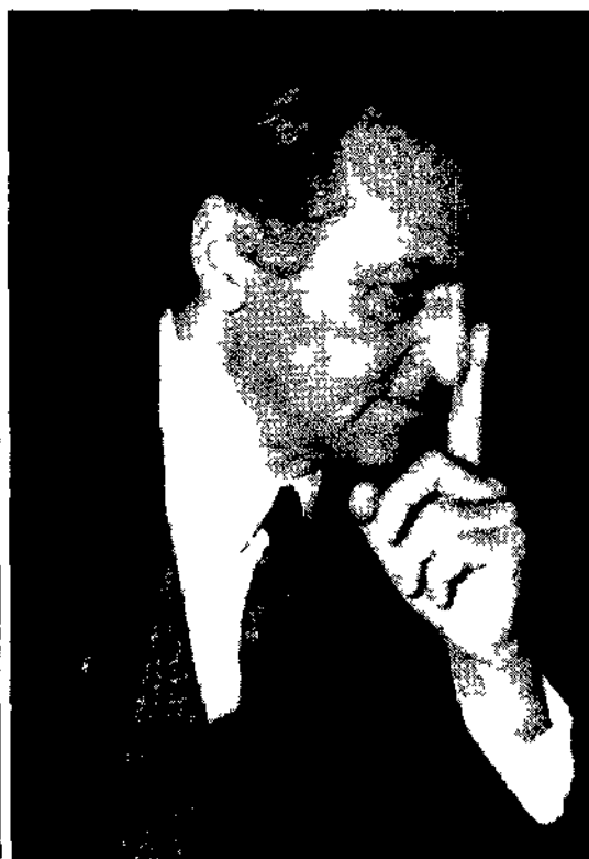
Renzo Arbore De Luigi Elige