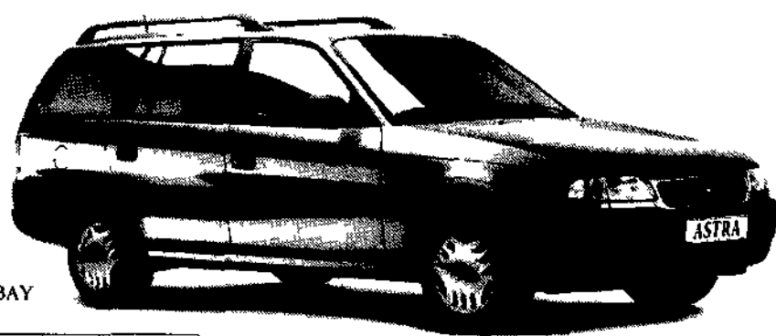
ASTRA SW FREEBAY 1 4i 82 CV