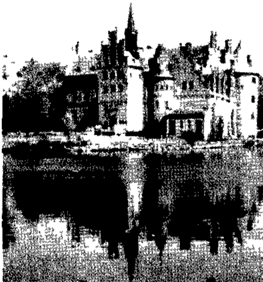
Copenaghen, il castello di Rosenborg

viaggi individuali e di gruppo in Italia e all'estero crociere e soggiorni al mare e ai monti notizie e curiosità dove, quando e a quanto