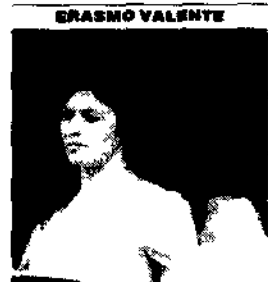
Anna Caterina Antonacci