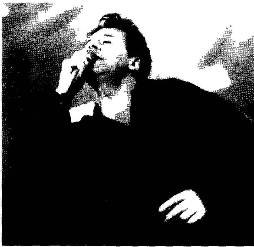
Jim Kerr, leader dei Simple Minds