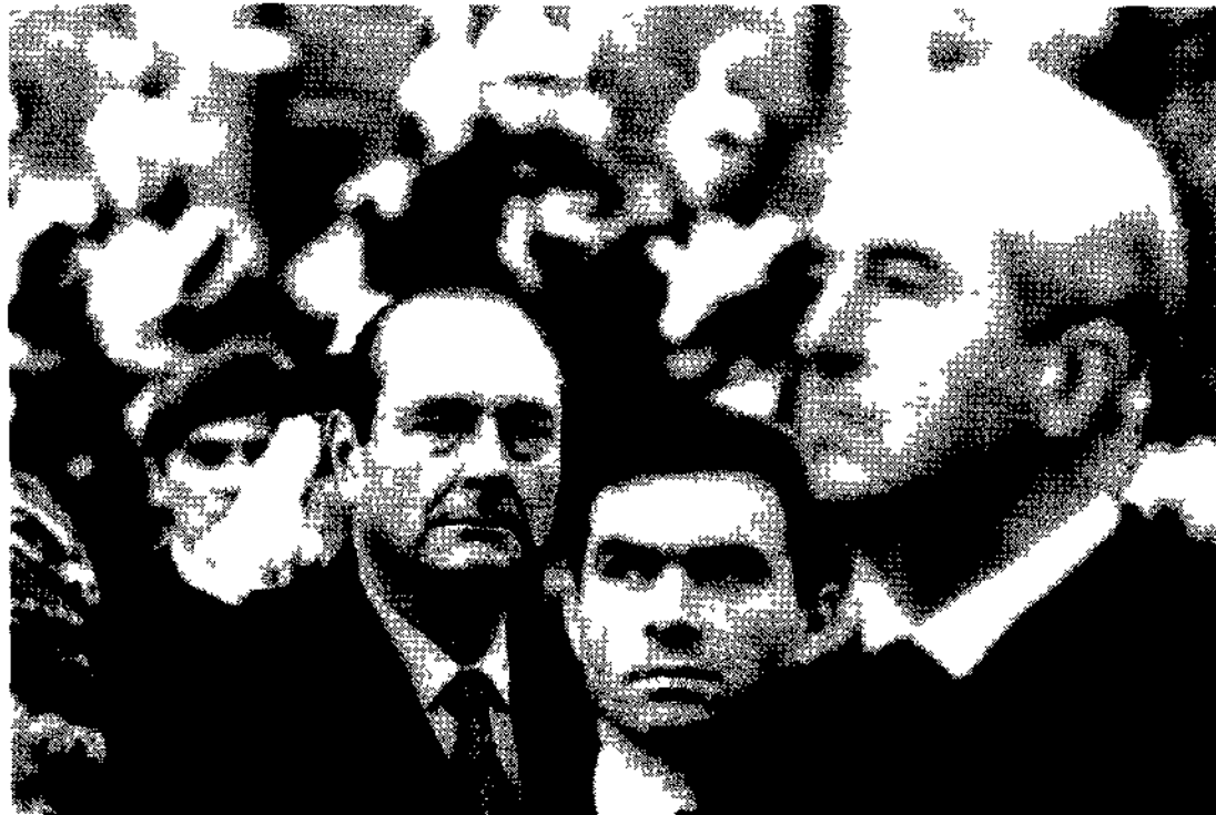
Edouard Balladur e Jacques Chirac