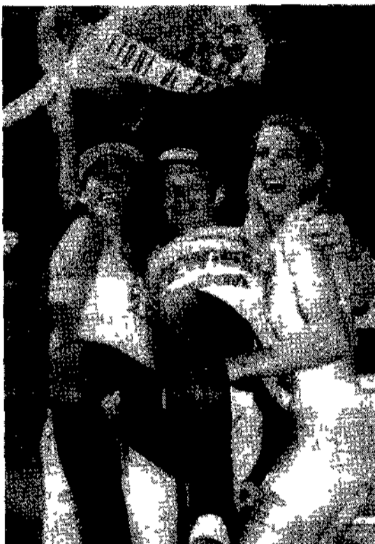
Il russo Eugeni Berzin vincitore dell'ultimo giro

Favorito? Quando se lo sente dire, Rominger scuote la testa. Mi sento bene, ma voglio vivere alla giornata. Se temo la sfortuna? Dopo l'ultimo Tour sono cambiato. Prima volevo sempre vincere ora prendo le cose con più filosofia e se qualcuno mi batte perché è più bravo di me tanto di cappello. Ne