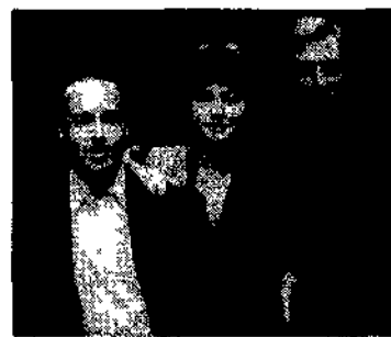
Gli interpreti di «Solei Viviani»