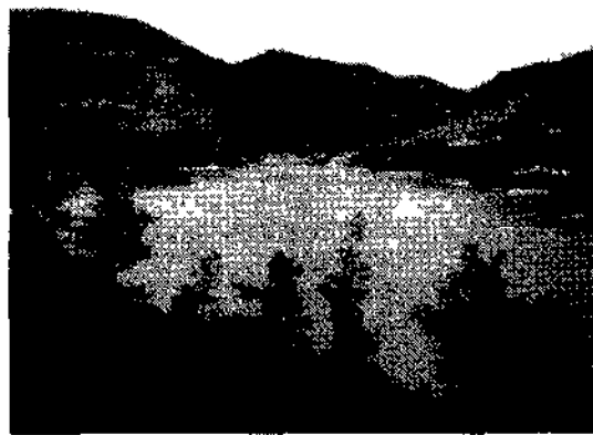
Il lago di Fiandra