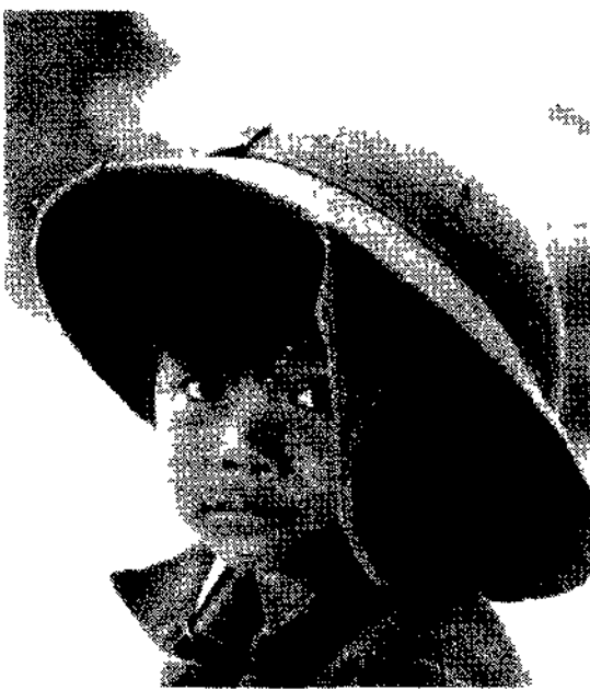
Vietnam provincia di Koutum. Bambino della minoranza Ba-Me

viaggi individuali e di gruppo in Italia e all'estero crociere e soggiorni al mare e ai monti notizie e curiosità dove, quando e a quanto