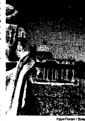
Fabio Fiorani / Simexi