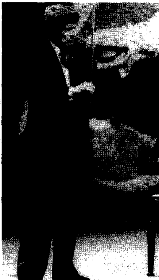
Il violinista Uto Ughi