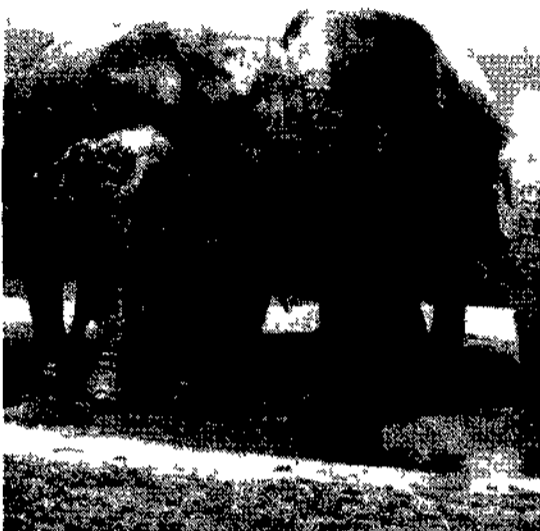
Sud Africa, Parco Kruger

viaggi individuali e di gruppo in Italia e all'estero crociere e soggiorni al mare e ai monti notizie e curiosità dove, quando e a quanto