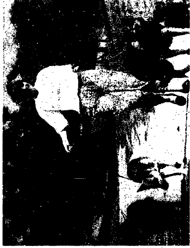
Roberto Barberis D.A. Photo press

IL PROGETTO. Spazi verdi per gli animali in ogni punto della città