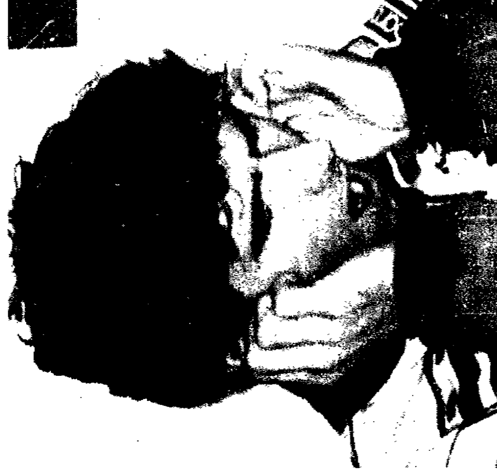
Damon Hill miglior tempo provvisorio al G.P. di Francia

Per il resto, questa, prima sessione di prove del Gp di Francia, si è contraddistinta per l'assenza delle Minardi, clamorosamente messe sotto sequestro giovedì sera, per una storia di debiti in seguito alla tempestosa vicenda del motore Mugen-Honda (che per contratto doveva andare alla scuderia di Fiorani e invece è finito alla Ligier). Con un comunicato diffuso ieri pomeriggio, la Minardi dichiara di non voler accettare ricatti: il provvedimento che ha colpito la casa italiana - sottolinea la nota - riguarda l'interruzione del pagamento operato dalla Minardi in quanto il team ha ravvisato che sostanzialmente gli stessi crediti non solo hanno avuto parte determinante nella sottrazione ad ac-