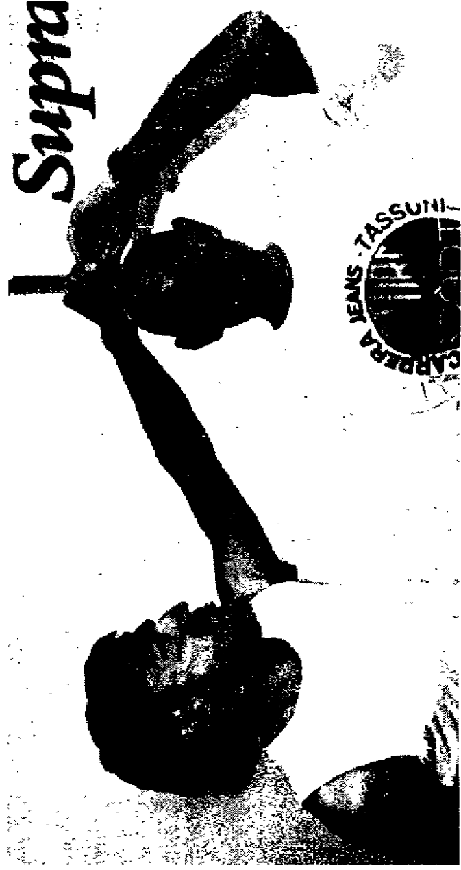
Claudio Chiappucci scherza con Marco Pantani durante le visite mediche