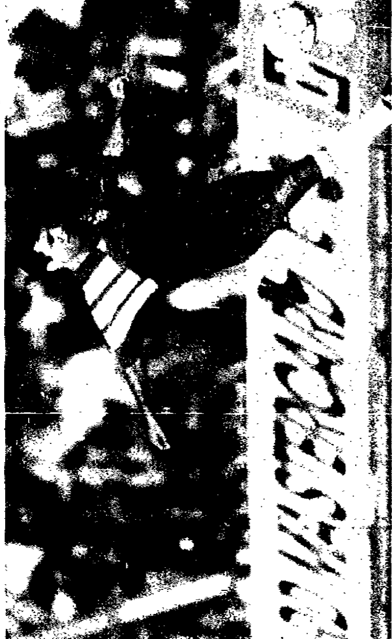
Hristo Stoichkov, nuovo attaccante del Parma

Alle 15 è arrivata comunque la lumata bianca, le firme sul contratto e la stretta di mano. Ai 900 milioni di pesetas - 1,2 miliardi equivalenti al costo del giocatore - il club emiliano ha dovuto aggiungere altri 1400 milioni, accollandosi così una sorta di buonsuscita che sarebbe toccata al club catalano. Contratto triennale per il bulgaro, che guadagnerà oltre 2 miliardi a stagione, senza contare i proventi che gli arriveranno dal suo nuovo ruolo di uomo-immagine Parmalat sul mercato dell'est Europa, a fine carriera, poi. Stoichkov diventerà manager dell'azienda in Bulgaria. Nato a Plovdiv l'8 febbraio '66, il nuovo astro del Parma è alto 1,80 e pesa 73 kg: la sua carriera è iniziata nel Maritima a 16 anni; nell'84 è passato al Celta Sofia, col quale ha vinto tre scudetti e tre Coppe di Bulgaria; l'attaccante passò però la seconda stagione in tribuna per una rissa in campo che gli costò un anno (pena poi dimezzata) di squal-