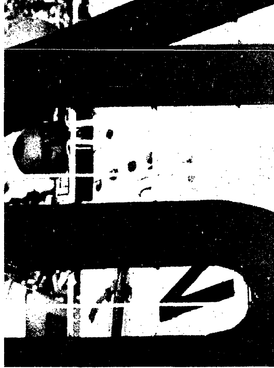
Un militare tedesco della forza Onu a Sarajevo