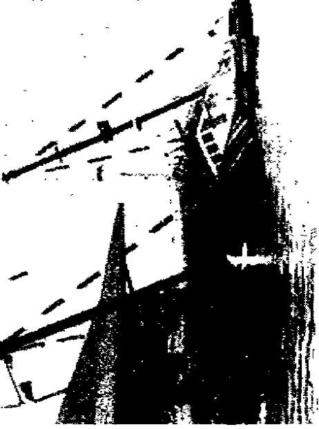
La Rainbow Warrior affondata nel '85