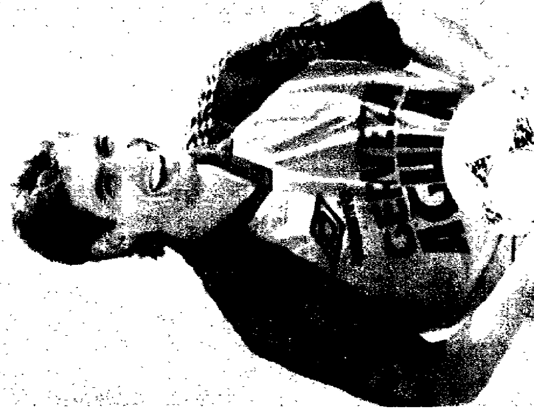
Andres Escobar. Il calciatore colombiano ucciso a Medellin nel luglio scorso