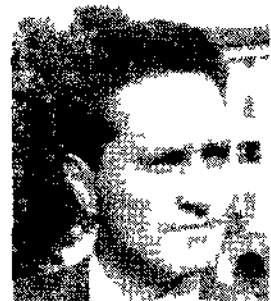
Francesco Rutelli