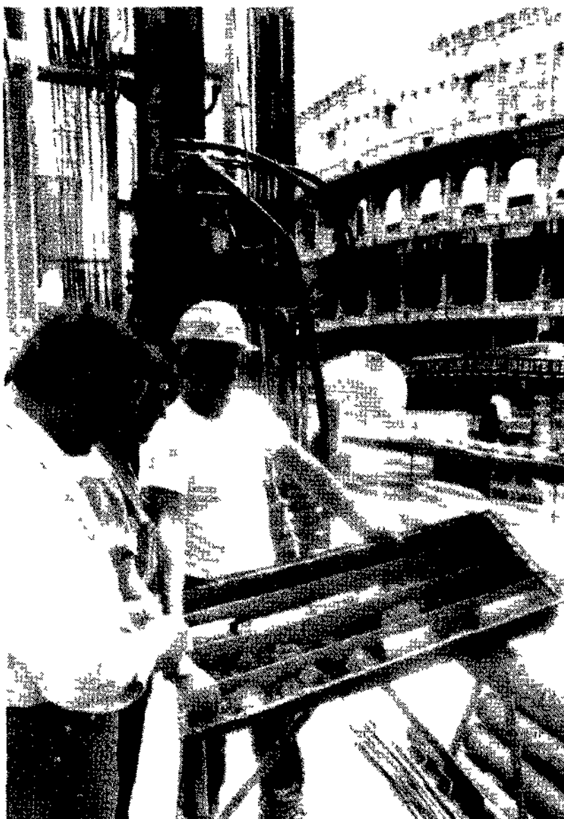
I lavori della linea C della metropolitana