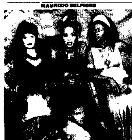
Il gruppo Zap Mama

■ Bastano delle donne e la musica cambia. No, non si tratta del preclama di qualche imponente playboy da spiaggia ma di una realtà difficile da negare. L'altra sera al Live Link Festival erano di scena Joan Armatrading preceduta dalle Zap Mama e seguita da Angela Baraldi ed il gentil sesso delle sotto note ha fatto tombola. Il pubblico se ne è accorto ed ha tirato tardi (la Baraldi ha finito di suonare all'una e mezza dopo una personale versione di Nothing compares to you di Simone di Connor). Se infatti la femminilità tanto piace al mondo della moda e della pubblicità che la utilizzano per suggerire, abbellire o semplicemente riempire i messaggi immaginari sfidate se la stessa femminilità è spesso gradita anche ad una discografia di consumo (e non solo) quando si tratta invece di «essere donne» e questo avviene in maniera autonoma libera quasi autarchica la differenza è schiacciante.