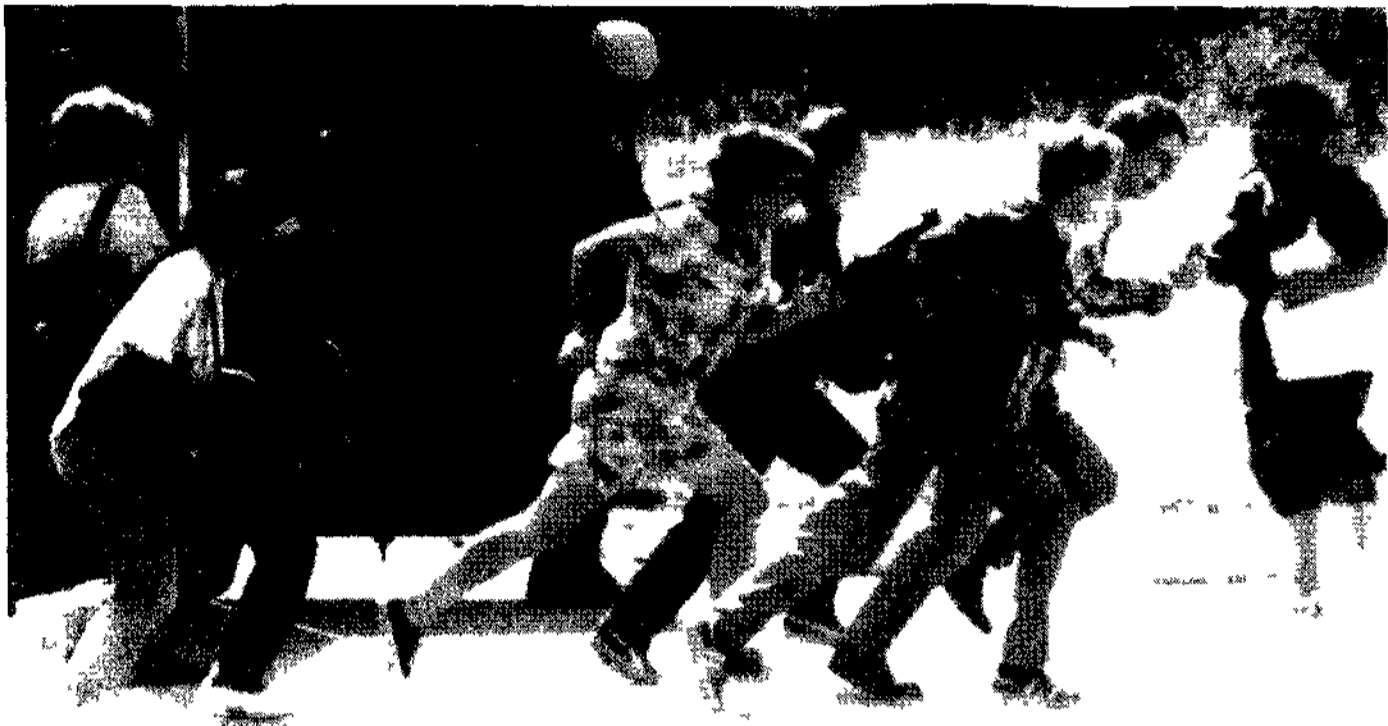
Abitanti di Sarajevo cercano di sfuggire al fuoco dei cecchini

Dopo la conquista della città, scatta la pulizia etnica. Altri caschi blu in ostaggio, bombe su Zepa e Sarajevo