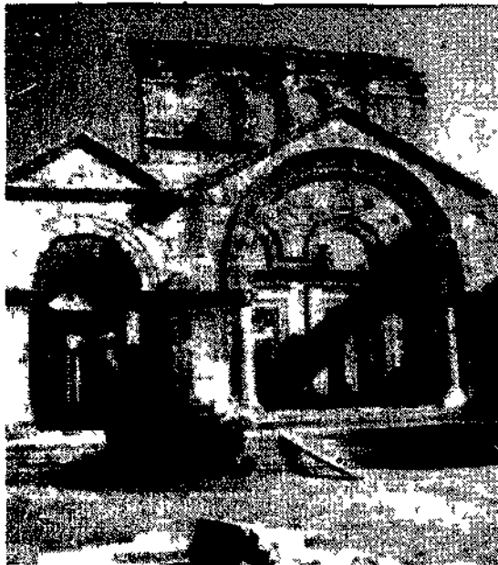
Siria. La Basilica di San Simeone

viaggi individuali e di gruppo in Italia e all'estero crociere e soggiorni al mare e ai monti notizie e curiosità dove, quando e a quanto