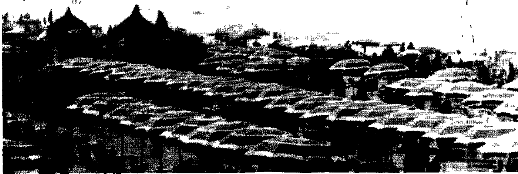
Un tratto di spiaggia della riviera Romagnola

Il monitoraggio della Lega Ambiente: è migliorata la condizione delle spiagge. Il 52% quest'anno è pulito