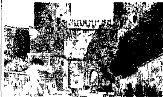
La trionfale Passeggiata Archeologica, tratto urbano dell'antica via Appia, nasconde dietro un muro, nel verde, la misteriosa via di San Sebastiano. Un percorso stretto pieno di luoghi preziosi: la chiesa di San Cesareo, la Casina del cardinal Bessarione e il Sepolcro degli Scipioni. Andando avanti si oltrepassa l'Arco di Druso e si arriva alla Porta San Sebastiano, con le sue due torri laterali, che apre il passo all'Appia Antica. Nelle Mura, percorribili e affascinanti, si trova il Museo delle Mura di Roma