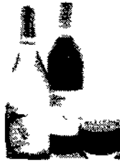
vincia di Padova) i toscani Vin Santo del Chianti e Vin Santo del Chianti classico...