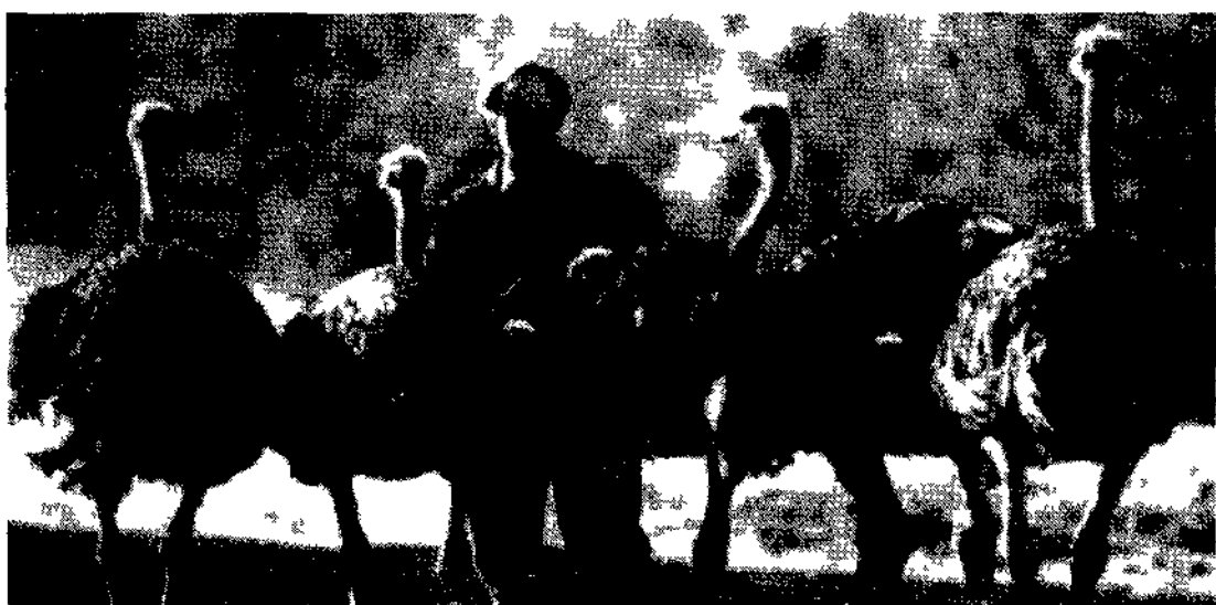
Un allevamento di struzzi