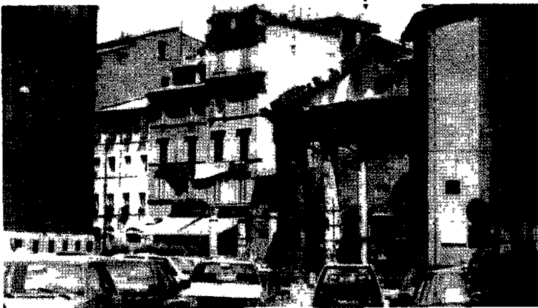
Il Portico d'Ottavia