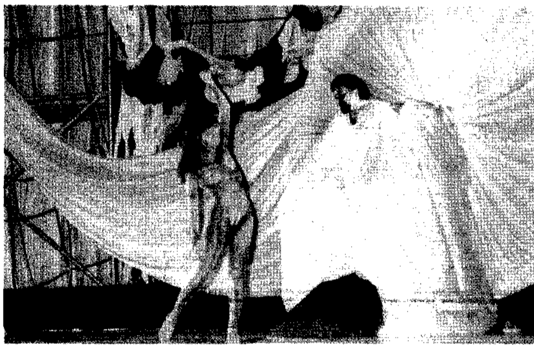
Il balletto di Spoleto in «Salomé» allestito nelle spazi di Eureka all'Eur. A destra i Bisca99Posse

L'idea, semplice semplice, pare che stia acquistando sempre maggiore successo: far visita ai monumenti nella loro anima, quando la cultura si stempera e secondo il freccetto della sera, in questa modo seguono volentieri le visite guidate non solo i turisti, che si sa, sono votati a qualunque sacrificio, ma perfino i romani - de Roma. All'idea dell'andar in giro con il naso all'insù di notte si è aggiunta l'offerta speciale-Artasani: con un solo biglietto quattro suggestive passeggiate notturne con una formula che offre, a lire 18.000, quattro tagliandi validi per un museo, un'area archeologica, una visita guidata alle fontane e una cena-consegna al Caffè Caprarica, usufruibile anche in giorni diversi fra loro, a scelta entro il 16 settembre. I biglietti sono disponibili solo in prevendita presso i negozi italiani: Maseurzio, Orto, Caffè Caprarica e la discoteca Fiorucci. Oggi alle 17 e alle 18 visite guidate al Museo Barracco, e alle 21 al Museo di Augusto e all'Arco Pace.