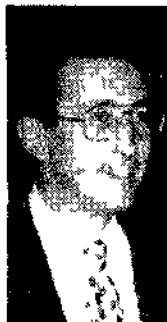
Gianfranco Fini e Silvio Berlusconi