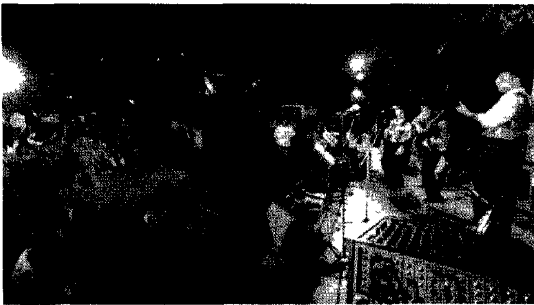
Un momento dell'Estate Romana al parco di San Sebastiano per la terza edizione de «La voglia matta»

La Commissione Roma Capitale ha approvato formalmente la modifica della destinazione di alcuni fondi, per un complesso di 46 miliardi, assegnati alla fase preparatoria degli interventi per il Giubileo. Così, sono stati risparmiati nei mesi di tempo, senza attendere l'approvazione della Finanziaria, per gli interventi più lunghi e complicati, ad esempio la linea C della metropolitana e il sottopassaggio del Lungotevere Castello, e che dunque richiedono di accelerare il più possibile i tempi di progettazione, affidamento ed esecuzione per essere completati entro il 2000. Gli interventi autorizzati sono, oltre a sottopasso e metro C, quelli relativi alla sistemazione dell'area di S. Pietro e della basilica di S. Maria Maggiore, San Paolo, Santa Croce, il collegamento Olimpico-Piazza Sacchetti, la Tangenziale Orientale le linee di tram, il palazzo di via del Profetto.