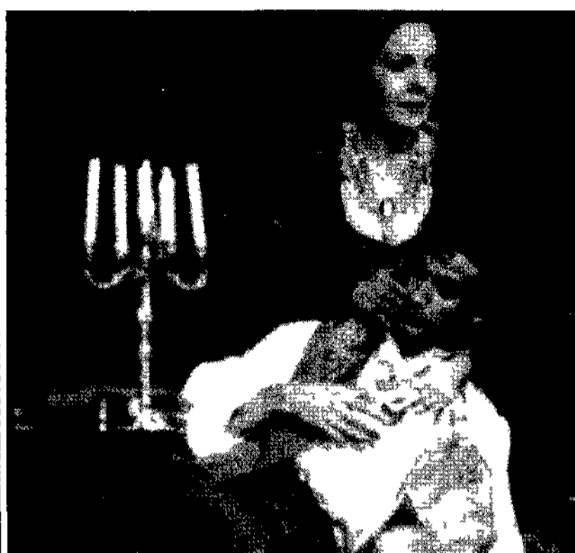
Fabio Armiliato in una scena della Tosca

A Teramo sbarcano i cantastorie i cantastorie. Non sono scomparsi, ancora e da tre anni si danno appuntamento in Abruzzo, a Montorio al Vomano, per la precisione. Da oggi a giovedì prossimo, infatti, si svolge nelle vie e nelle piazze di Montorio al Vomano, organizzata dall'Arco di Teramo, la terza edizione della rassegna "in-Cantastorie". Apre la manifestazione, una delle voci più belle della scena folk italiana (e internazionale) Lucilla Galeazzi con un concerto di canti e suoni della tradizione popolare. Domani è la volta di Massimo Monaco in "Morlatten" e dell'one man band Bernard M. Snyder. Martedì Toni Cosenza propone "L'Italia cantata dal Sud". Mercoledì arrivano i suoni e i canti irlandesi del Mc & O e giovedì, infine, chiusura con "Il Tratturo", musica popolare meridionale.