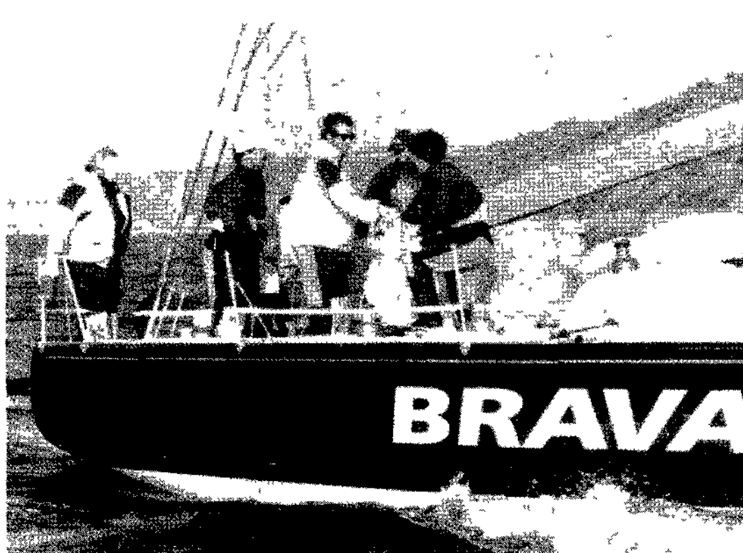
Brava Q8 e prima nel Fastnet nella sua classe