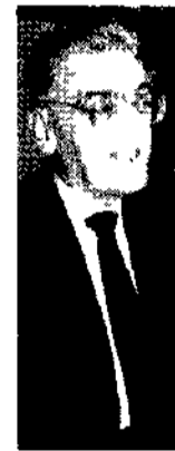
Tancredi Bianchi, presidente dell'Abi. Sotto, Paolo Leon

ROMA Per la lira la stagione della grande paura è ormai alle spalle. Ma è necessario procedere in avanti con le privatizzazioni per garantire al cambio l'ossigeno sufficiente a confermare la ripresa.