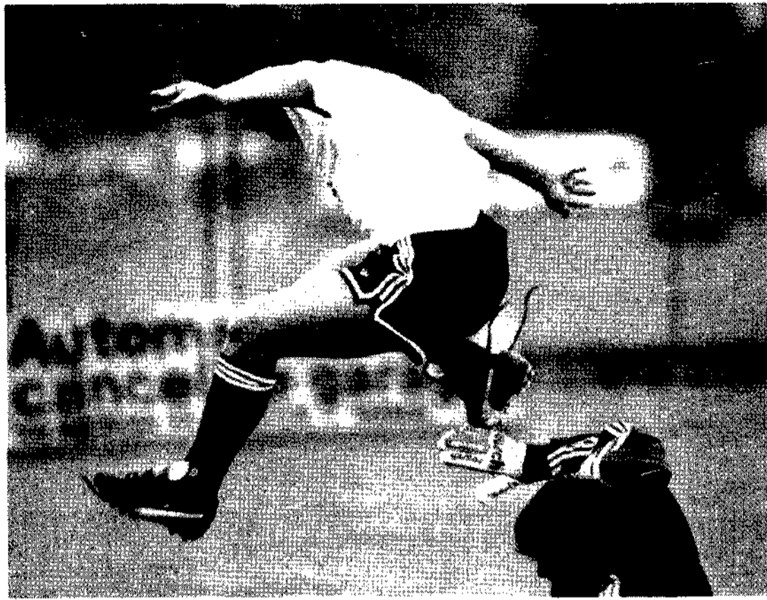
Moradona: anche sui giocatori accusa di corruzione

STEFANO BOLDRINI C'erano una volta le partite comprate e vendute alla paesana. Si corrompevano un paio di giocatori, preferibilmente il portiere e il centravanti, e il golino era fatto. Una manciata di soldi, buoni per farsi il giardino di casa o comprare l'automobile alla moglie. Capitava sul finire della stagione, quando c'era da salvare la pelle o da conquistare uno scudetto.