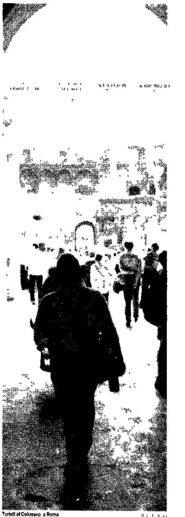
Turisti al Colosseo a Roma

Le mie mie? Macché, perdersi pure e allora si limitano ad una discrezione e rivelano che l'inserto è un principio di lavoro di Varese, che evidentemente intende, come per i barbi di un discreto messaggio povero. Le tariffe invece non sono un mistero e anche se il prezzo di un'intera pagina di giornale è questo, è questo il prezzo di un'intera pagina di giornale e con se le parole, come nel 80 mila.